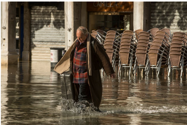
Okolje, Italija © Fabrizio Troccoli.