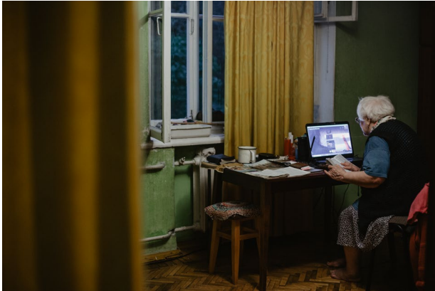
Medgeneracijska solidarnost, Poljska © Marta Rybicka.