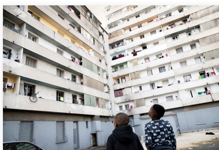
Kader št. 2