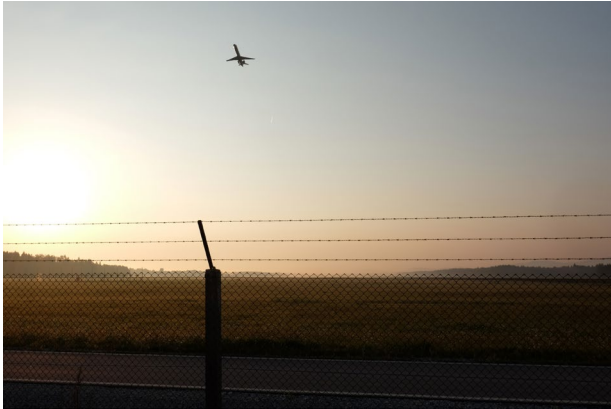
Migracije, Slovenija © Danijel Modrej.