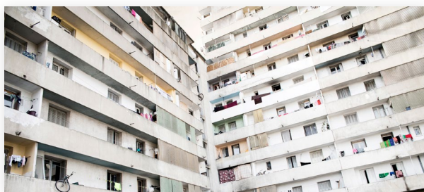
Kader št. 1