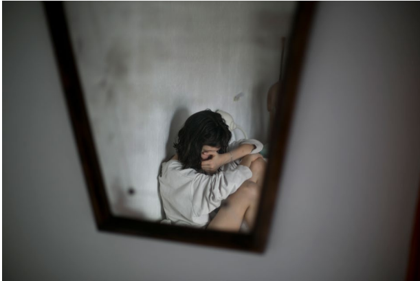
Duševno zdravje, Španija