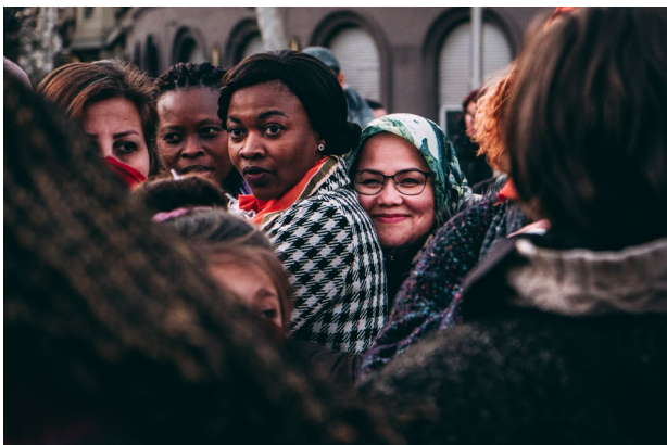
Ljubezen in bes, Hrvaška © Lara Varat.