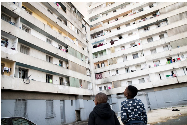
Diskriminacije, Francija