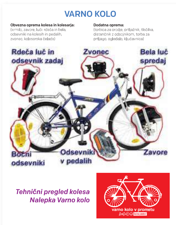
Slika 2: Plakat Varno kolo

Teoretični del kolesarskega izpita poteka v spletnem portalu Kolesar. Učenec lahko najmanj dvakrat ter ne