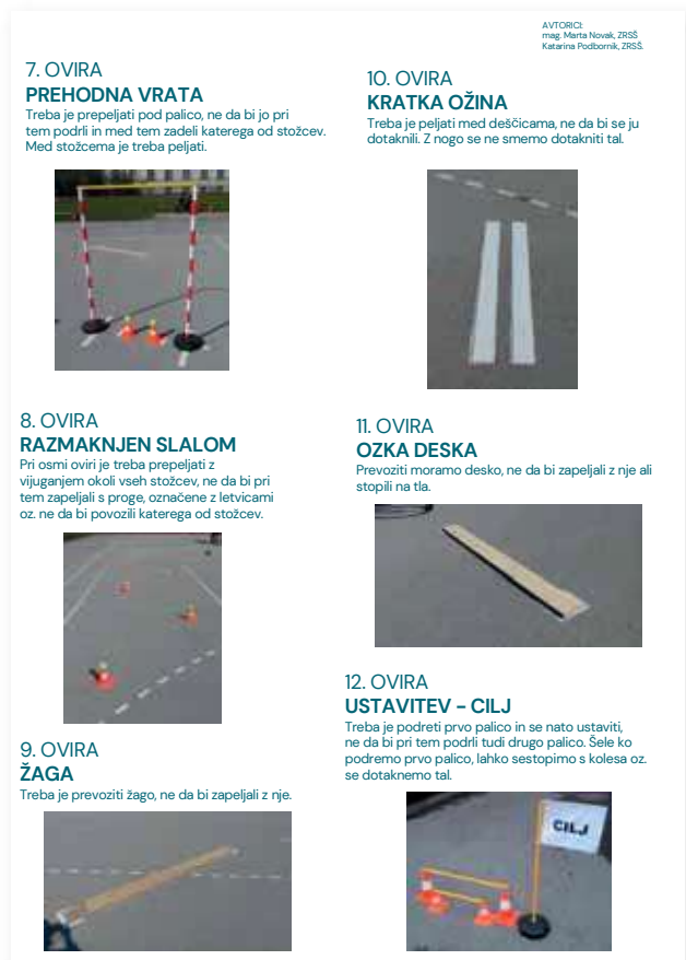
Slika 1: Plakat Načrt poligona. Prirejeno po AVP.