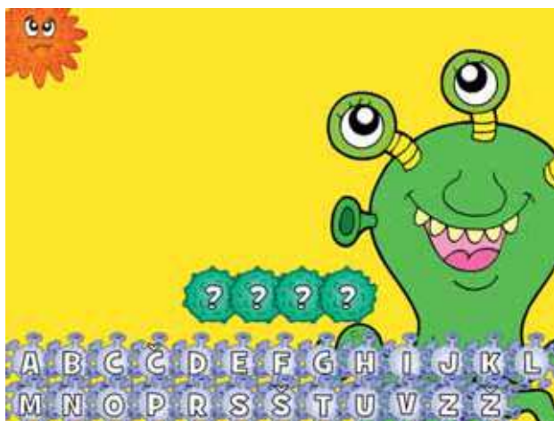
Slika 2: Interaktivne vaje, Vislice – vozila (Vidmar, D, b. d.).

Aktivnosti za učence so različne, npr. priprava voznih pasov s lepilnim trakom, domači Drive-in kino, razvrščanje prometnih sredstev, Varno čez cesto ipd. (Kuhar Koren, 2015 in Gregorač Tomše, 2020). Na voljo so tudi različne interaktivne igre za učence, npr. Prometni znaki, Mreža besed – vozila, Vislice – vozila, Zbirka nalog o prometu, kjer učenci rešujejo različne naloge, pri katerih rešujejo mrežo besed z vozili, rešujejo vislice z vozili ali preverjajo znanje prometnih znakov (Vidmar, 2020). V času izobraževanja na daljavo so interaktivne vaje uporabne za utrjevanje prometnih vsebin, saj so prosto dostopne.