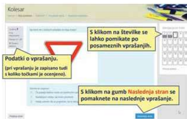
Slika 3: Testiranje kolesarjev v spletni učilnici Kolesar (Simulacija, 2019)

V drugem vzgojno-izobraževalnem obdobju se v področje trajnostne mobilnosti umešča usposabljanje za vožnjo kolesa in kolesarski izpiti ob podpori SIO Kolesar (Simulacija - Testiranje kolesarjev v spletni učilnici Kolesar, 2019). Učenec spoznava cestnoprometne predpise za kolesarje. Teoretični del usposabljanja za vožnjo kolesa in kolesarskega izpita poteka preko spletnega portala, kjer se učitelj in učenci vpišejo z uporabniškimi imeni in gesli. Teoretični del kolesarskega izpita poteka v programu Kolesar, kjer učenci rešujejo testne pole.