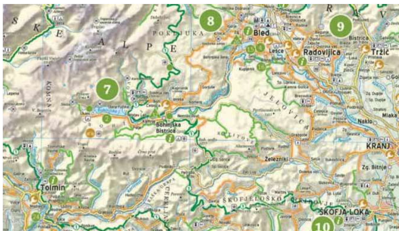
Slika 9: Prikaz Gorenjskega dela kolesarskih poti po Sloveniji (Interaktivna kolesarska karta Slovenije, b. d.)