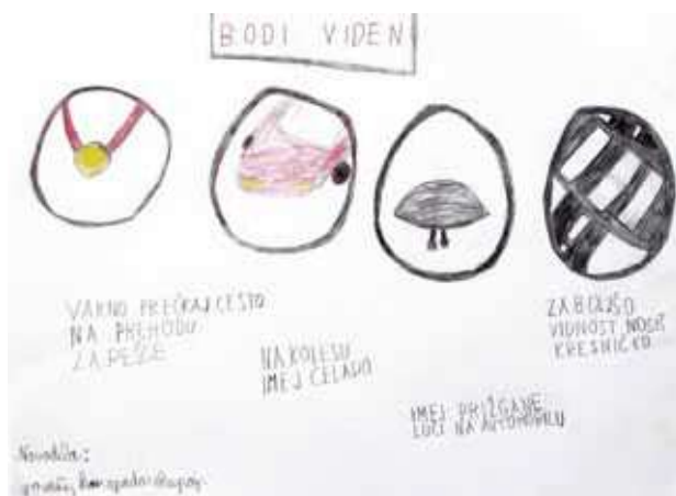
Bodi varen in viden; avtor Tadej Danijel, 4. razred, Osnovna šola Globoko

Kolesarska zveza Slovenije. (2016). Spletna stran. Pridobljeno 22. 10. 2020 s spletne strani: https://kolesarska-zveza.si/sl/home-2/ .