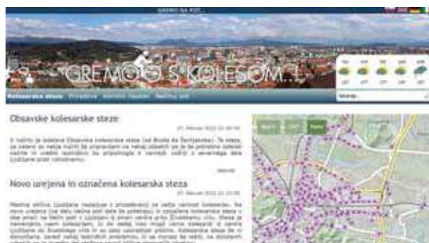
Slika 7: Kolesarske poti (Gremo na pot, 2012).

V pomoč je tudi spletni portal Gremo na pot (Gremo na pot, 2012), ki objavlja novice o kolesarskih poteh, kolesarskih stezah, prireditvah, koristne napotke in načrtovanje poti. Opisanih je 67 poti v skupnem številu 2300 km.