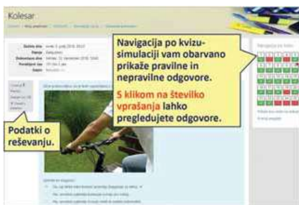
Slika 4: Simulacija – Testiranje kolesarjev v spletni učilnici Kolesar (Simulacija, 2019).

Za uporabo spletnega portala so na voljo pripravljena navodila, v katerih je podrobno razložena izvedba kolesarskega izpita, ki je pripravljena v skladu s konceptom Usposabljanje za vožnjo kolesa in kolesarski izpit v osnovni šoli (Žlender, 2016). Spletna skupnost KOLESAR SIO.SI ponuja vrsto gradiv, ki podprejo učitelja pri izvedbi kolesarskega izpita. Učiteljem je na voljo simulacija izpita, simulacija s testiranjem kolesarjev, gradivo za praktično vožnjo (Prometni poligon za kolesarje, Spretnostni poligon – ovire, Spretnostni poligon – postavitve A, Spretnostni poligon – postavitve B, Ocenjevalni list – spretnostni poligon A, Ocenjevalni list – spretnostni poligon B, Zapisnik o pregledu kolesa), program S kolesom v šolo in različni videovodiči (KOLESAR SIO.SI, b. d.).