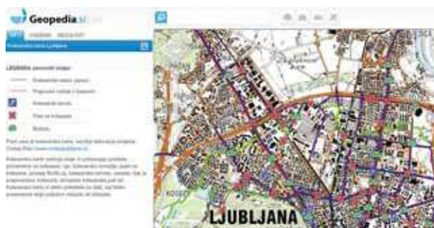
Slika 6: Geopedei (Interaktivna kolesarska karta Ljubljane, 2013).

informacijami glede kolesarjenja v mestu. Zemljevid se dopolnjuje s kolesarskimi izletniškimi točkami in t. i. črnimi točkami v krajini. Nastal je s sodelovanjem MOL in Urbanističnega inštituta RS v projektu CIVITAS (MOL, 2010).