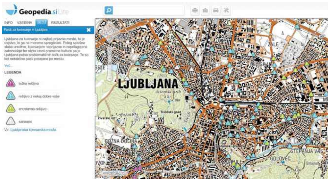
Slika 8: Nevarna mesta pri kolesarjenju (Pasti za kolesarje, 2013).

Naložimo si jo lahko tudi z brezplačno aplikacijo Layer,