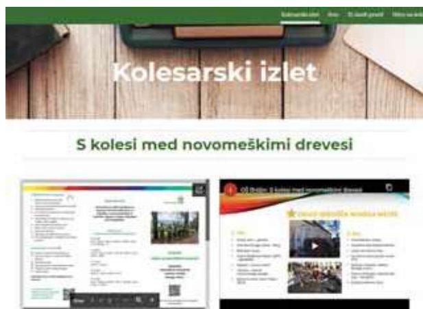
Slika 5: Kolesarski izlet: S kolesi med novomeškimi drevesi. (Gole, I., 2020).

Pri načrtovanju kolesarskih poti je na voljo tudi več spletnih strani. Ena takih je interaktivna kolesarska karta Ljubljane Geopedei (Interaktivna kolesarska karta Ljubljane, 2013), ki je spletni zemljevid s ključnimi