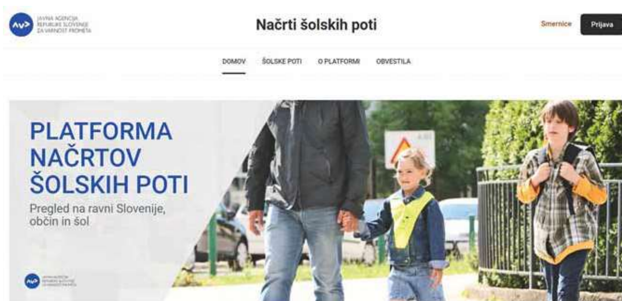
Slika 1: Načrt šolskih poti (Spletni portal Načrti šolskih poti, (b. d.)).