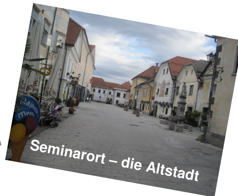
Seminarort – die Altstadt