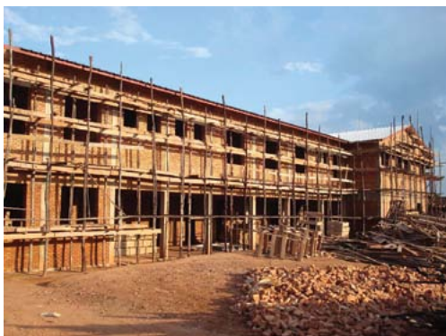
Gradnja porodnišnice v Ruzu.

Med nevladnimi organizacijami v Sloveniji so na področju 5. milenijskega cilja aktivni Center za promocijo zdravja, ki deluje pod okriljem Slovenske filantropije, Združenje naravni začetki in Društvo Živa. Te nevladne organizacije informirajo in osveščajo tako ženske kot moške o pravicah do varovanja spolnega in reproduktivnega zdravja ter zdravega odnosa do spolnosti.