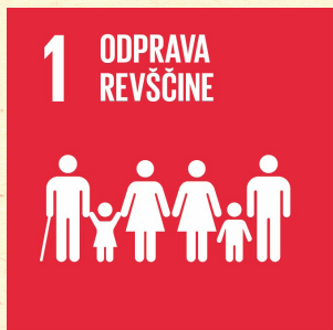
Tabela s sličicami in opisi posameznih ciljev trajnostnega razvoja Agende za trajnostni razvoj 2030

CILJ 1. Odpraviti vse oblike revščine povsod po svetu