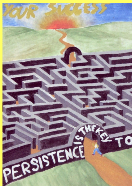
Delavnica: How to Live the Life