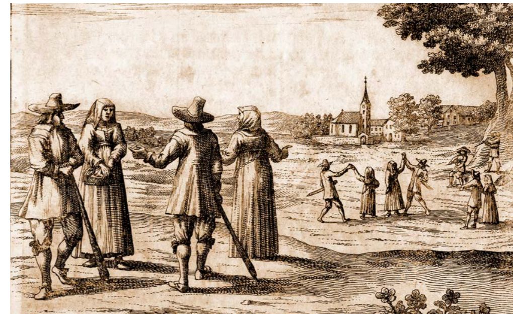
Gorenjci (zgoraj) in Dolenjci (spodaj) v Valvasorjevi Slavi vojvodine Kranjske iz leta 1689. Valvasor, Die Ehre deß Hertzogthums Crain VI , str. 279, 289

Več o Gorenjcih, Dolenjcih in Notranjcih gl. v: Boris Golec, »Nastanek in razvoj slovenskih pokrajinskih imen z ozirom na identitete prebivalcev«, v: Vizija raziskav slovenske gospodarske in družbene zgodovine , ur. Darja Mihelič, Ljubljana: Založba ZRC, 2014, str. 337–348. ■