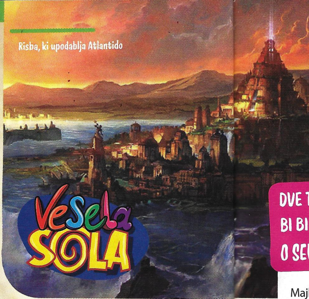
Risba, ki upodablja Atlantido

D raži pilovci, novo šolsko leto z našo revijo je pred nami. Tokrat bomo še bolj skrivnostni kot lani. Iskali bomo največje skrivnosti zgodovine, ki jih do sedaj še nihče ni pojasnil v celoti. Teга tudi mi ne bomo zmogli. Toda kdo ve, morda se kdaj komu od vas posreči razkriti nerazkrito in se s tem zapisati v zgodovino.