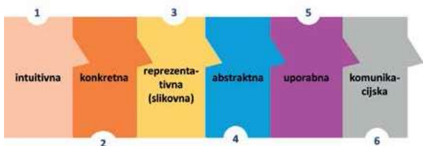
Shema: Stopnje/koraki obvladovanja matematične veščine

Za razumevanje avtomatizacije poštevanke je z didaktičnega vidika treba razumeti tudi stopnje obvladovanja matematične veščine (Sharma, 1990). Prikazuje jih spodnja shema: